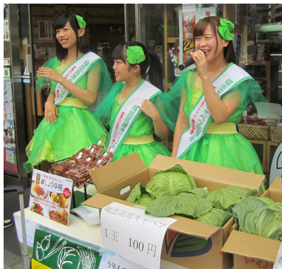
ご当地アイドル「あかぎ団」

群馬県産夏秋キャベツの都中央入荷量は、6月下旬からダントツの1位を維持しています。群馬県の6～7月の都中央入荷量は前年比115%で、今後も順調な入荷が見込まれます。