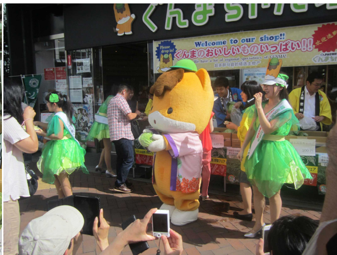
「ぐんまちゃん」も加わり消費宣伝