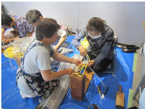
六合ぞうり創作の様子

吾妻地域の「なす」、「ズッキーニ」、「とうもろこし」、「キャベツ」、「トマト」及び高山村の伝統野菜である「高山きゅうり」の販売が行われました。吾妻地域は標高が高く食味が良いことをPRしながらの販売は好調でした。なかでも、「高山きゅうり」は、お客様の目を引き、「何これ？」「どうやって食べるの？」といった質問が多く、「高山きゅうり」の紹介と料理方法を載せたリーフレットで説明するとほとんどの方が購入されました。