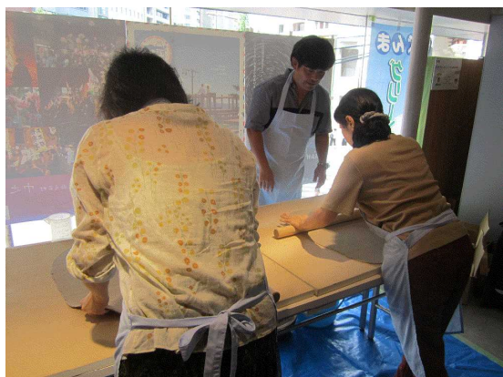
そば打ち体験の様子