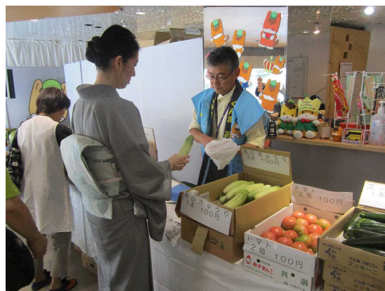
農産物販売の様子