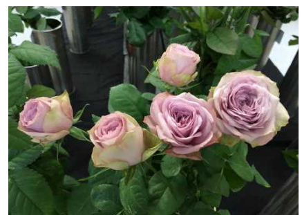
近年人気のあるアンティーク調の品種