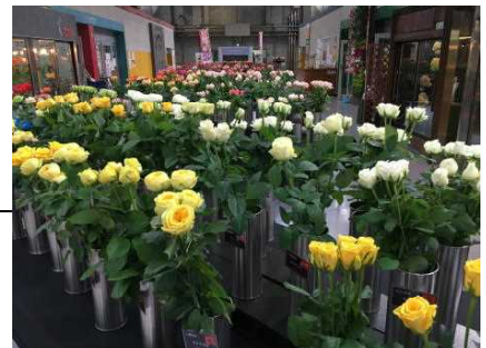
通路を埋め尽くす鮮やかなバラたち