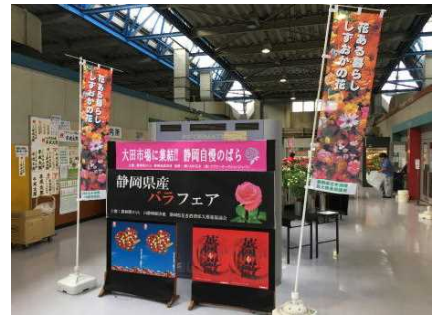
静岡県産バラフェア

静岡県は、バラの出荷量全国2位であるほか、東京都中央卸売市場ではシェア15%を占め産地別1位となる重要な産地となっています。ちなみに静岡県ではその他ガーベラ生産量が全国一であるなど、下図のとおり温暖な気候を活かし多様な花きの生産が盛んに行われており、花き産出額は全国5位の180億円(平成26年)となっています。