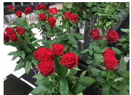
赤バラの代表格「サムライ08」

本県においても今月行われた国際フラワーEXPO等への出展を継続するとともに、市場における認知度の向上を図るため、品質の高さ等の産地の魅力を発信するなど、全国有数の産地に負けない取り組みを実施していくべきだと考えます。