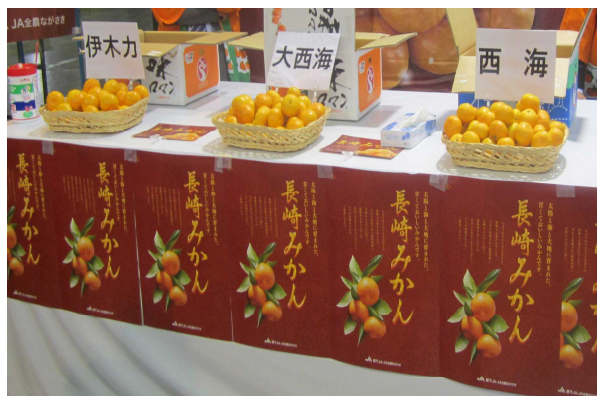
早生みかん3銘柄の展示

長崎県では、シートマルチ栽培を行い糖度12度以上のものを、「味ロマン」、「味まる」として販売しています。さらに糖度が13度以上になると「長崎の夢」、「味っ子」として、糖度14度以上を最高級品「出島の華」としてブランド化しています。