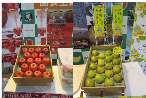
りんごとラ・フランスの展示

山形県では、ラ・フランスの熟度を均一にするため、収穫後すぐに2～5℃で10日間程度予冷します。その後追熟することで肉質や香りが良くなるとのことでした。常温にもどして2～3週間後が食べ頃になるそうです。