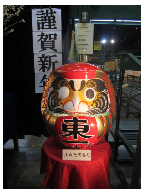
JAたのふじのだるま