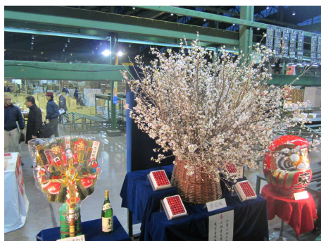
「福を呼ぶ縁起物」の様子