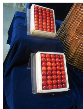
JAてんどうのさくらんぼ