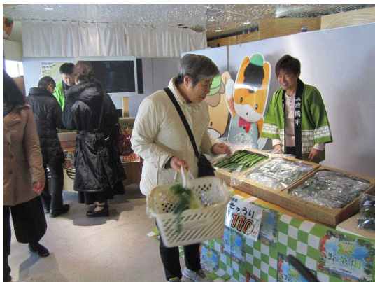
農産物直売の様子

「千代の厳選卵」は、(有)後閑養鶏園のブランド卵で、餌の原料にこだわり季節によって配合を変える等の工夫をしており、代々続く純国産の鶏の卵の味は、こくが深く甘みがあると評判です。「まえばしうどん」は、前橋産の小麦(さとのそら)を100%使用し、前橋市内の製麺所が特許を取得した「竹割風」という技術を用いて、麺に竹節の様な形状を入れているのが特徴で、麺とつゆがよくからみおいしくいただけるということです。