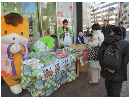
「ぐんまちゃん」も一緒に店頭販売