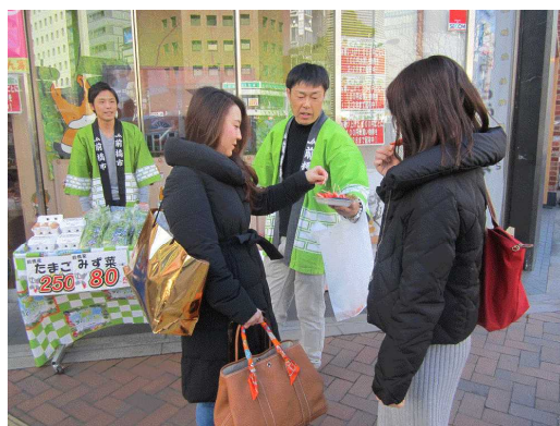
いちご試食の様子