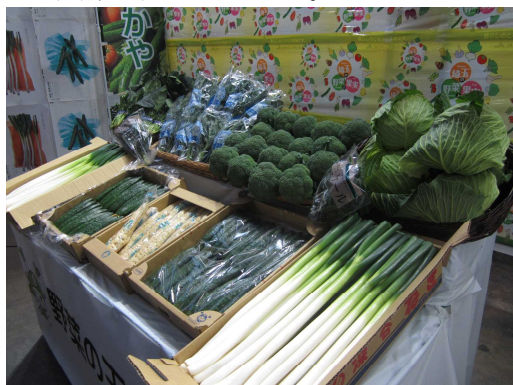
JAふかや産野菜展示の様子

当日は、深谷ねぎの味噌汁ときゅうりのディップソース和え(バーニャカウダー味)が市場関係者に試食提供されました。特に味噌汁は、「深谷ねぎが甘くておいしい。」と大変好評で、あっという間に終了しました。