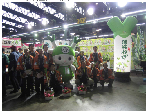
JAふかやと深谷市職員が大田市場でPR