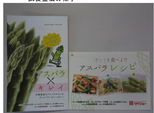
九州主産県合同のアスパラガス販促資材