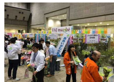
市場協力のもと、産地自らPR販売

本県においても花き産地PRは、国際フラワーEXPOをはじめ各市場等で産地ごとに行われていますが、本イベントのような業界関係を含めた一般向けの大規模イベントへの出展も効果的と考えられます。行政の支援のもと、産地主導の積極的な産地PRによる産地振興が期待されます。