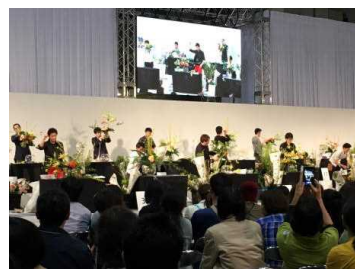
ジャパンカップセミファイナル