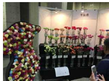
千葉県単独出展の様子

* ボックスフラワー とは、鉢の代わりに箱を容器として、主に茎葉を除いた花部分のみを箱の隅々まで敷き詰めたフラワーアレンジの一つで、飾りやすさや持ち運びやすさ、または作りやすさの点で近年ギフト用などで広がっている。