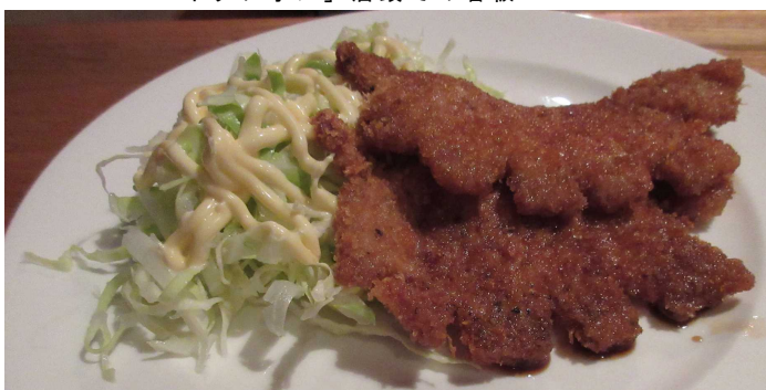
特注のソースかつ