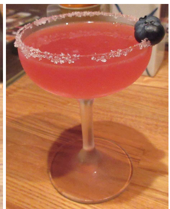
「ブルーベリーカクテル」