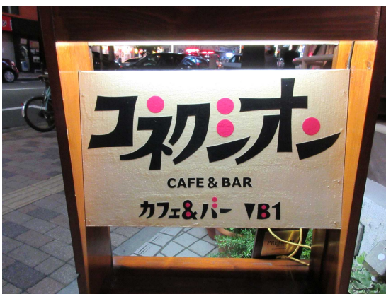
「コネクション」店頭での看板