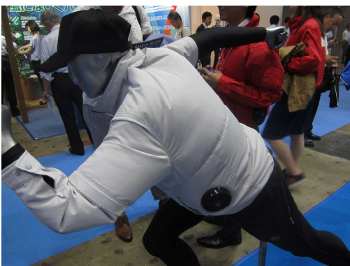
(株)サンエスの空調服