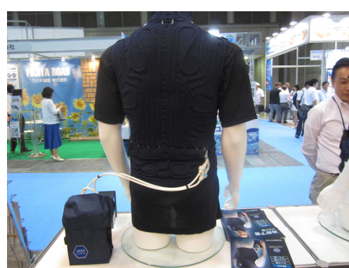
帝国繊維(株)の冷却ベスト