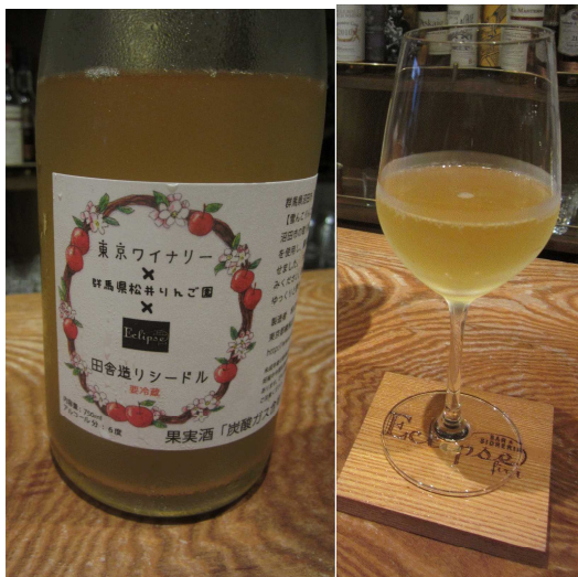
雪んこりんごを使った「群馬シードル」