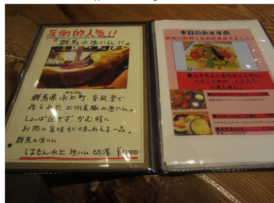
メニューで群馬県産をPR