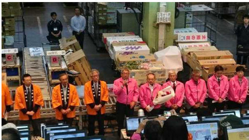
せり前あいさつの様子