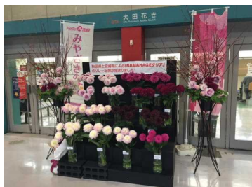
中央通路での展示

リレー出荷が行われるのはNAMAHAGEダリアシリーズの中の4～5品種で、市場展示ではその両県で共通した品種を用意し、リレー出荷となる上で重要な品質格差がないことをPRしました。