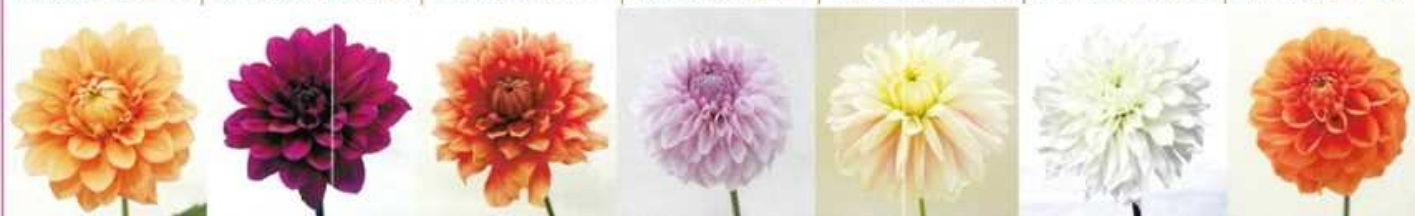
NAMAHAGE ソレイユ | NAMAHAGE クイーン | NAMAHAGE オータム | NAMAHAGE ニュアンス | NAMAHAGE ドルチェ | NAMAHAGE ヘガサス | NAMAHAGE キャロット