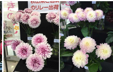
上段が秋田、下段が宮崎 品種は左が‘チーク’、右が‘キュート’