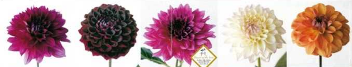
NAMAHAGE パーフル | NAMAHAGE /アール | NAMAHAGE マジック | NAMAHAGE レディ | NAMAHAGE サンセット