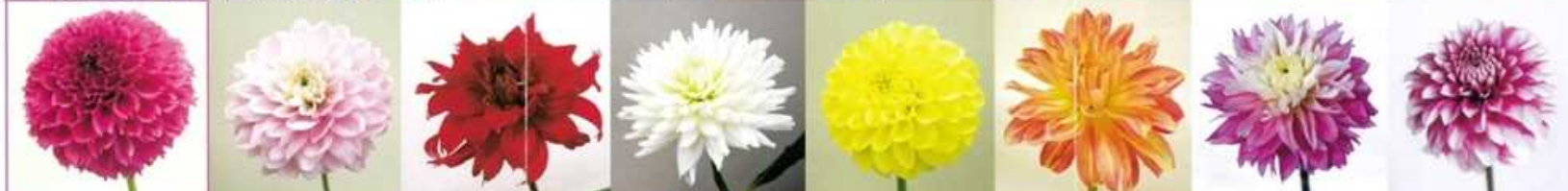
NAMAHAGE ハピネット | NAMAHAGE キュート | NAMAHAGE パッション | NAMAHAGE スワン | NAMAHAGE ムーン | NAMAHAGE カーニバル | NAMAHAGE フラミンゴ | NAMAHAGE ビューティ

ダリアは季節によって変化します。ダリアの花色や花型は季節によって変化します。全く違う花に見える品種もあります。これはダリアの特性ですので、ご了承いただきますようお願い致します。気になる方は市場や出荷元のJA等にお問い合わせの上、お求めくださいますようお願い致します。