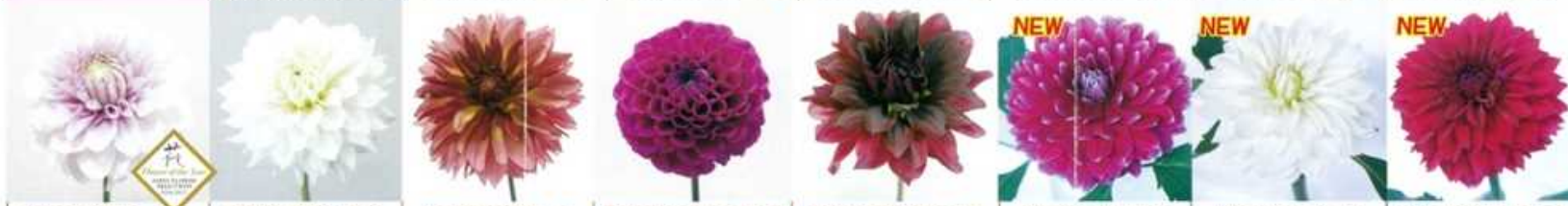
NAMAHAGE チーク | NAMAHAGE シフォン | NAMAHAGE オーフ | NAMAHAGE ローズカット | NAMAHAGE グラムリン | NAMAHAGE みやび | NAMAHAGE パール | NAMAHAGE トランフ