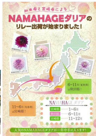
配布したリーフレット