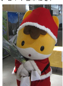
伊勢崎産ブランド農産物をPR