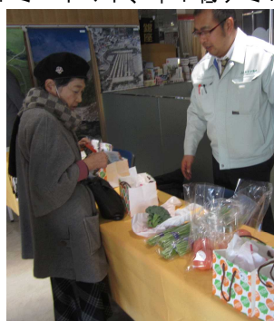
JA佐波伊勢崎ブース