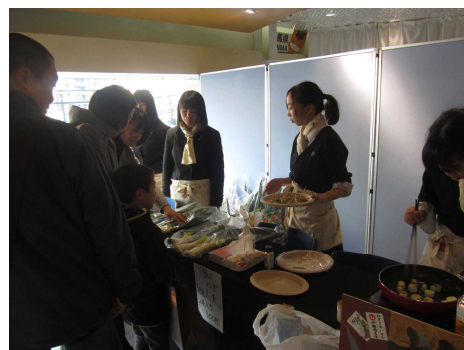
伊勢崎産ブランド農産物の販売や試食宣伝（左：ミニトマト、中：低アミロース米、右：下植木ねぎ）