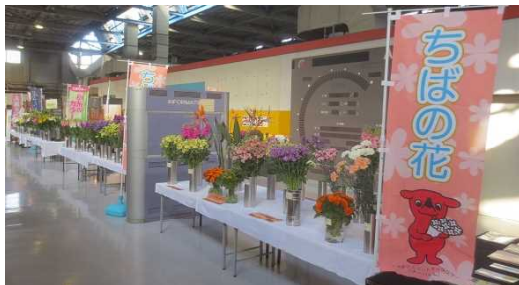
中央通路いっばいの展示PR