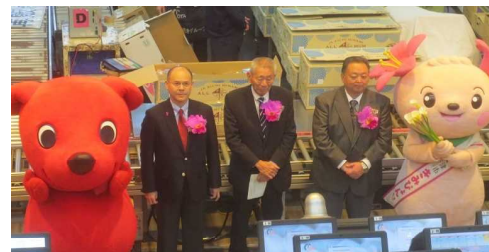
左から滝川副知事、朝生会長、三沢委員長