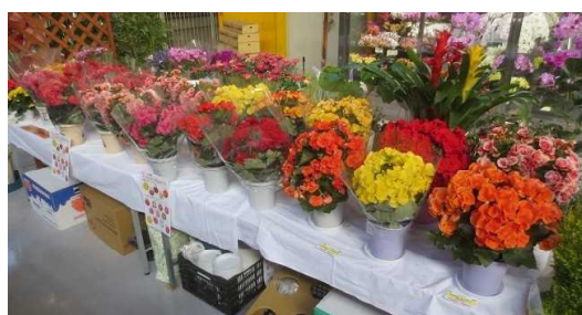
鉢花や観葉植物の展示も