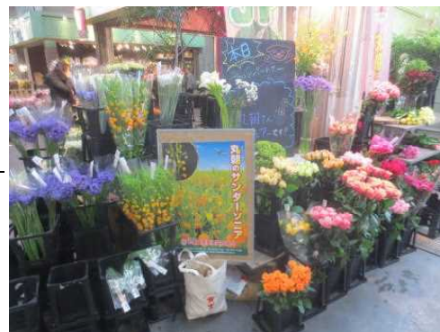
場内に入る仲卸店舗で千葉県産フェア

花きでは珍しい副知事などが参加するトップセールに加えて、たくさんのマスコットの参加、大規模な商品展示、仲卸を巻き込んだフェア開催など、そのPR効果を高める工夫は非常に参考となる取組でした。