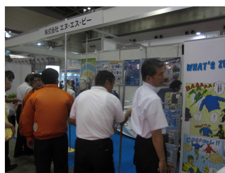
「(株)エヌ・エス・ピー」ブース