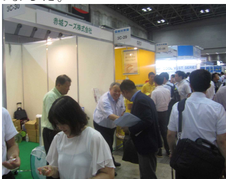
「赤城フーズ(株)」ブース

この他にも「シロキコーポレーション(株)」から屋根に塗るだけで太陽からの熱を効果的に反射して室内の温度上昇を抑える遮熱塗料「ミラクル」、「(株)アメフレック」から、気化熱の原理を利用した省エネで環境に優しい大型冷風機「ハイラン冷風機」等様々な猛暑対策商品が出展されました。