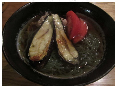
オール群馬県産の「夏野菜こんにゃく麺」