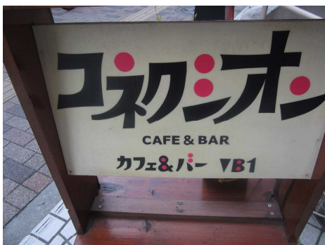
「コネクション」店頭での看板