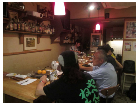
「群馬県出身者の会」の様子