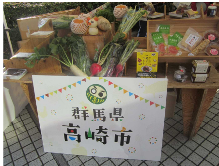
様々なチラシで高崎市をPR