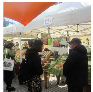
高崎そだちブース (左から島方ファーム、農園たお、浜名農園、農事組合法人くりさき、アルペロ)