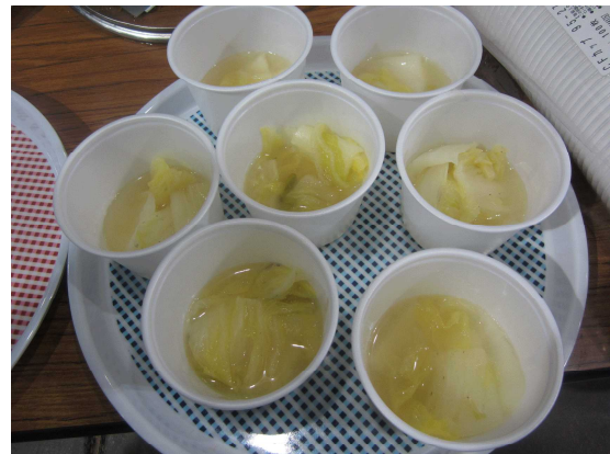
「邑美人はくさいのみそ汁」