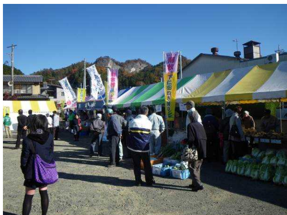
【昨年下仁田ねぎ祭り】