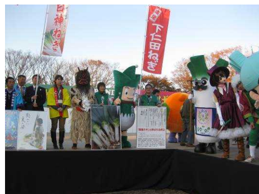
【昨年全国ねぎサミット】

開催目的 : 全国の主要なねぎ産地が一堂に会し、「ねぎ」を広く、強く情報発信することにより、国産ねぎの消費拡大をはかる。また、産地間の交流や情報交換により、各産地が抱える課題解決と関係者のスキルアップをはかる。 「下仁田町」「群馬県」が保有するさまざまな文化観光資源をPRし、知名度・イメージアップをはかり、地域産業の活性化を推進するため「全国ねぎサミット2014in ぐんま下仁田」を開催する。