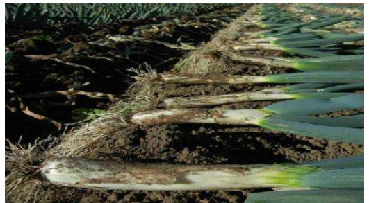
【収穫され天日にさらされる下仁田ねぎ】