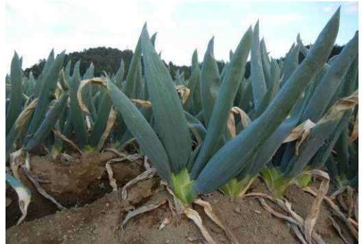
【栽培中の下仁田ねぎ】

その下仁田ねぎは、軟白部は長さ15～20cmと短く、また太さは最も太いもので直径4～5cmときわめて太いのが特徴です。生では辛味が強すぎて食べられないほどですが熱を通すと甘くなり、その特有の風味ととろりとした食感が食通をうならせませす。