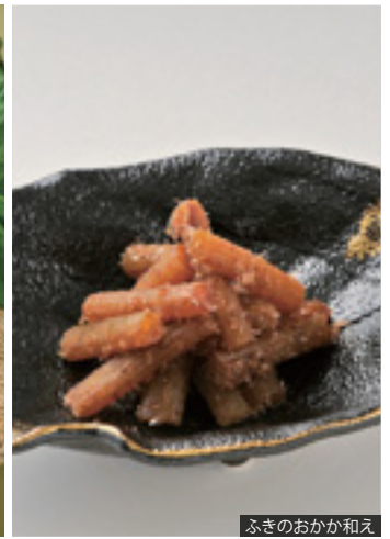
ふきのおかか和え