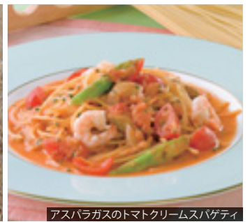
アスパラガスのトマトクリームスパゲティ