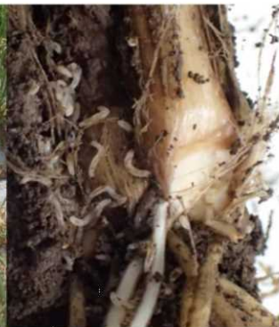
図2 ニラ地下茎葉部に寄生するネギネ

期及び生育期（4～11月）、捨て刈り直後（12月）及び収穫期（12～4月）にネギネの発生が見られた場合は、ランネート45DFによる灌注またはスタークル/アルバリン顆粒水溶剤による株元灌注処理を行うことで、ネギネの防除効果が得られます。また、ダントツ水溶剤（令和2年12月登録）の散布処理もネギネ防除に効果的です。なお、収穫終了後は、ニラ株にネギネ幼虫が寄生している可能性があるため、キルパーによる古株枯死処理を行うことが重要です。