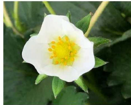
交配に用いられるイチゴの花