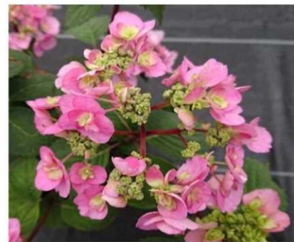
開花した有望系統

さて、現在の鉢物用アジサイは、花や葉が大きくなる品種が主流ですが、最近では、消費者の嗜好が変化し、コンパクトな品種が好まれるようになったため、花き系では、小鉢向きアジサイを育種目標に定め、品種育成に取り組んでいます。現在、有望系統を試作し、鉢花としての特性を評価するとともに、アジサイ農家からなる「群馬県アジサイ研究会」に御協力いただき、現地適応性試験を行っているところです。-----花き係