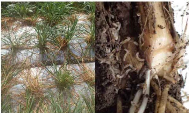
図1 ニラ地上部での被害

その結果、ランネート45DF及びアルバリン顆粒水溶剤の灌注処理により処理8、14日後にネギネの寄生頭数が減少したことから、これらの薬剤によるネギネの防除効果が示唆されました（図3）。この結果から、ニラのハウス栽培において、育苗