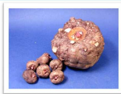
みやままさりの球茎と生子