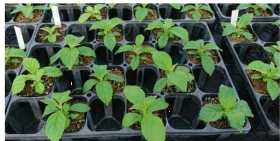
育成中のアジサイ実生