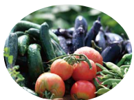
県内産農畜産物 (画像はイメージです)