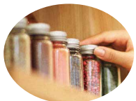
加工品 (画像はイメージです)