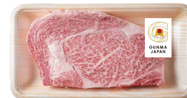
(画像はロゴマーク利用のイメージです)